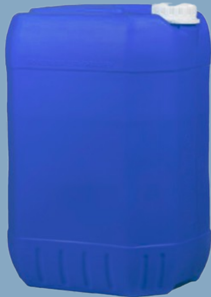
Fundo com reforço